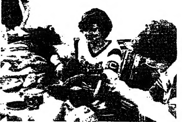
فتيات النادي يمدن السنديشات